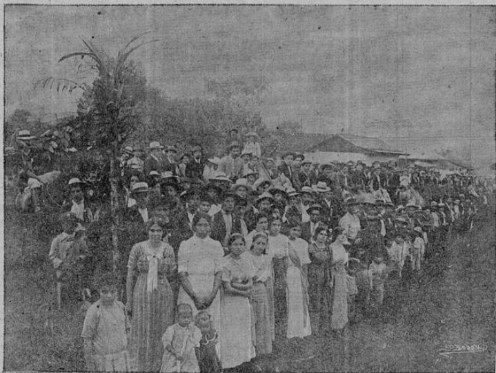
En San Marcos